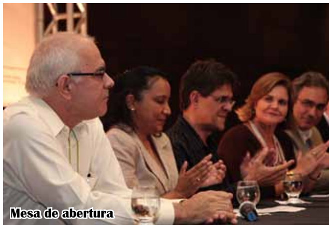
Mesa de abertura