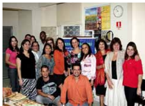
Conselheiros, funcionários e convidados na inauguração da estação BVS-PSI no CRP10

As portas do CRP10 estão abertas para quem quiser pesquisar na Biblioteca Virtual e não tem acesso à internet. O horário de funcionamento do Conselho é de Segunda a Sexta, das 8 às 12 e de 14 às 18 horas. Façamos uma visita!