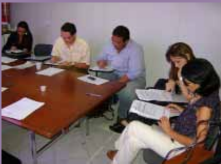
Profissionais respondem questionário

O Centro de Referência Técnica em Psicologia e Políticas Públicas - CREPOP deu início, em maio, ao processo de Pesquisa sobre atuação profissional de psicólogos (as) em Políticas Públicas sobre Álcool e outras Drogas. O objetivo é construir coletivamente as referências técnicas para uma competente atuação profissional nas políticas públicas brasileiras.