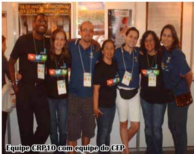
Equipe CRP10 com equipe do GCP