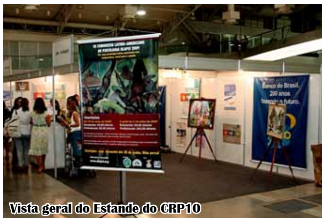
Vista geral do Estando do CRP10