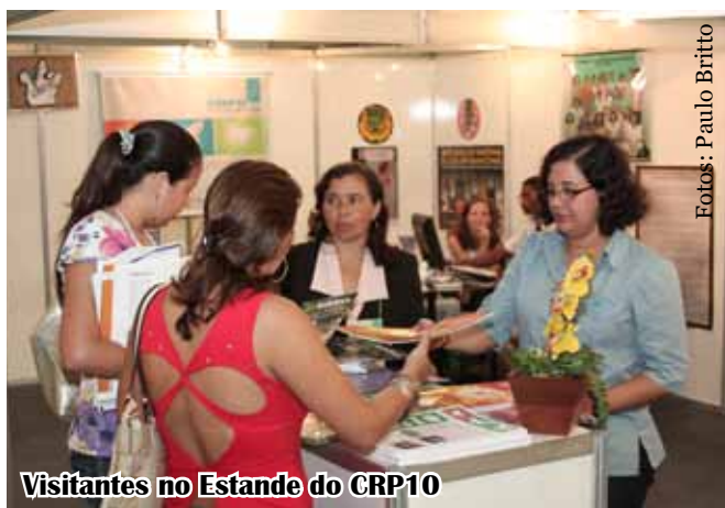
Visitantes no Estando do CRP10