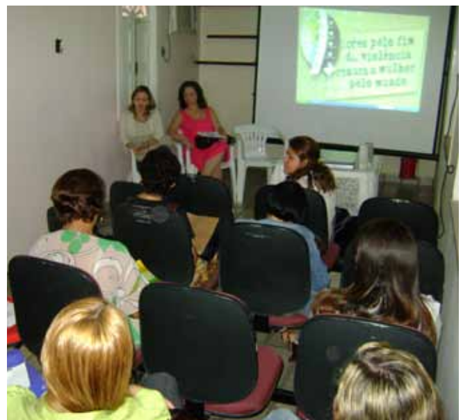
Convidadas compartilham experiências com o público

A reunião seguiu com um debate caloroso sobre a atuação do psicólogo nas ações de combate à violência contra a mulher, das dificuldades e avanços nessa área e encerrou com a aplicação do questionário aos psicólogos, onde eles responderam como tem sido a rotina de trabalho nesse campo de atuação.